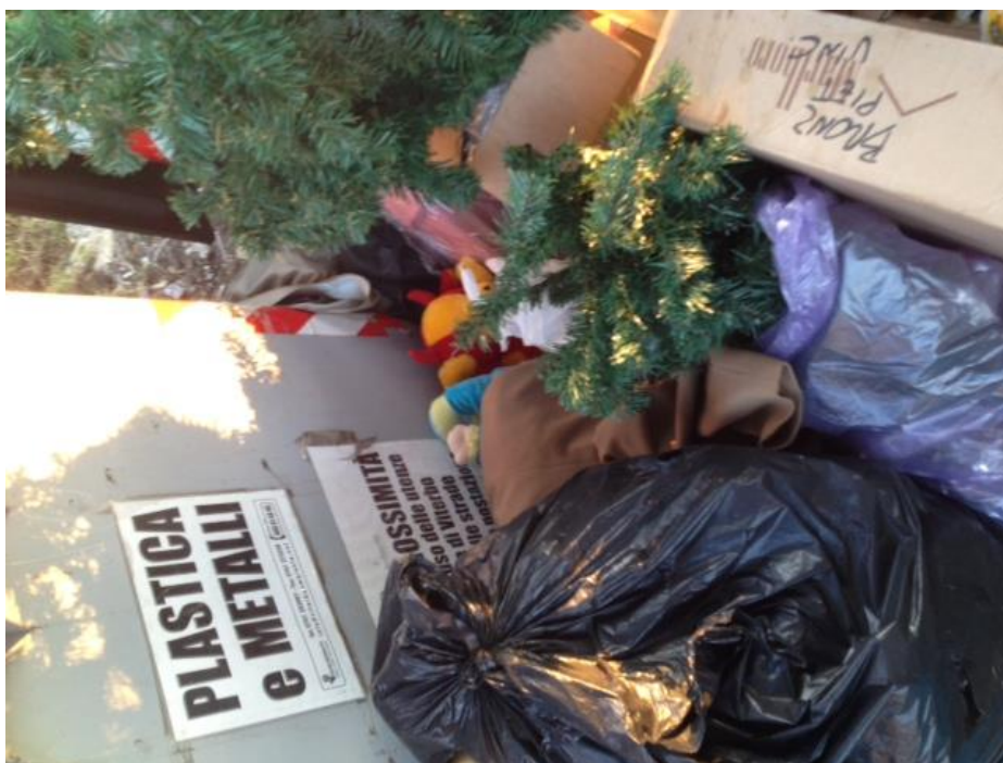
IP Str. Teverina tratto dismesso – 06.08.2014 ore 09.02 - POST RACCOLTA